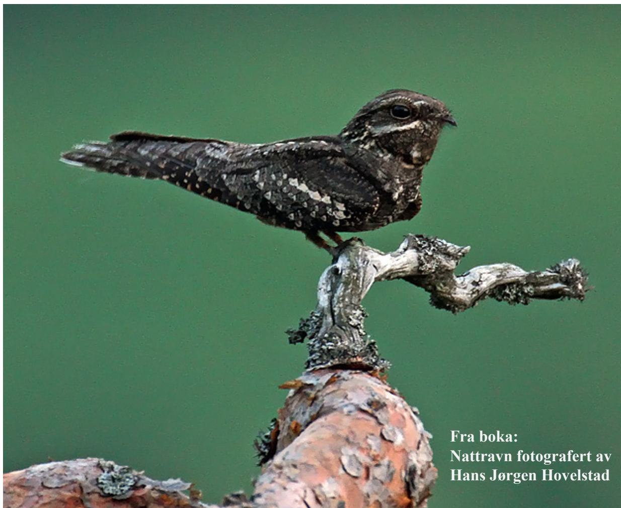
Fra boka: Nattravn