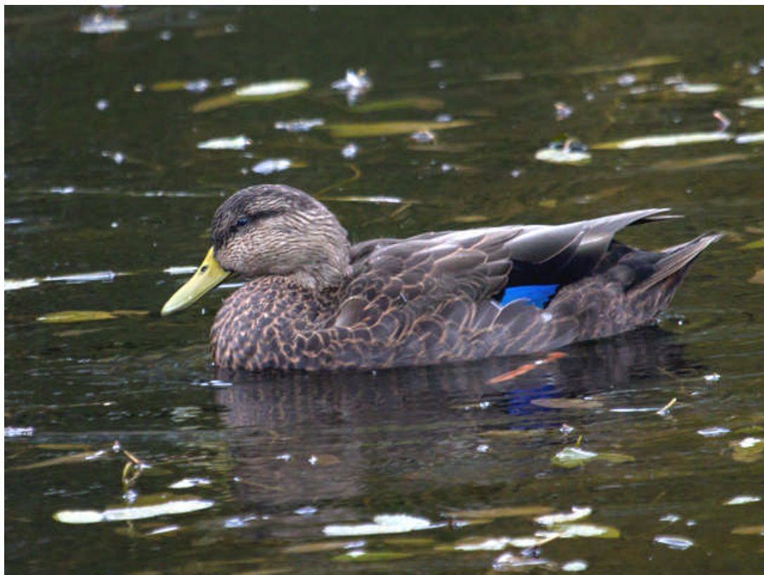
Fig.2: Rødfotand ♂, Mellomdammen i Sætre, Hurum, 22.9.2012. Siste nye art i Buskerud.