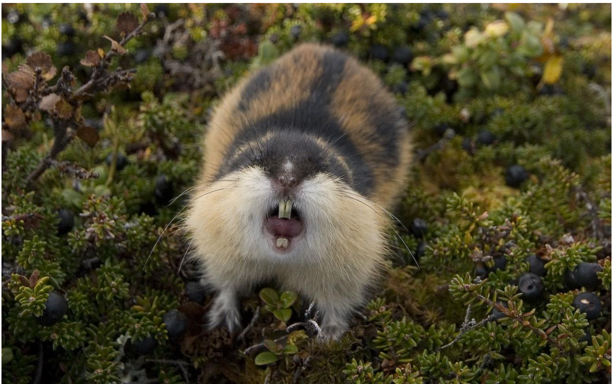
Fig.5. Lemen, en av hovedføden til fjellvåken. Har vist seg å glimre med sitt fravær de siste årene, - spesielt toppårene har manglet. Men i 2014 dukket den opp i anselige mengder.