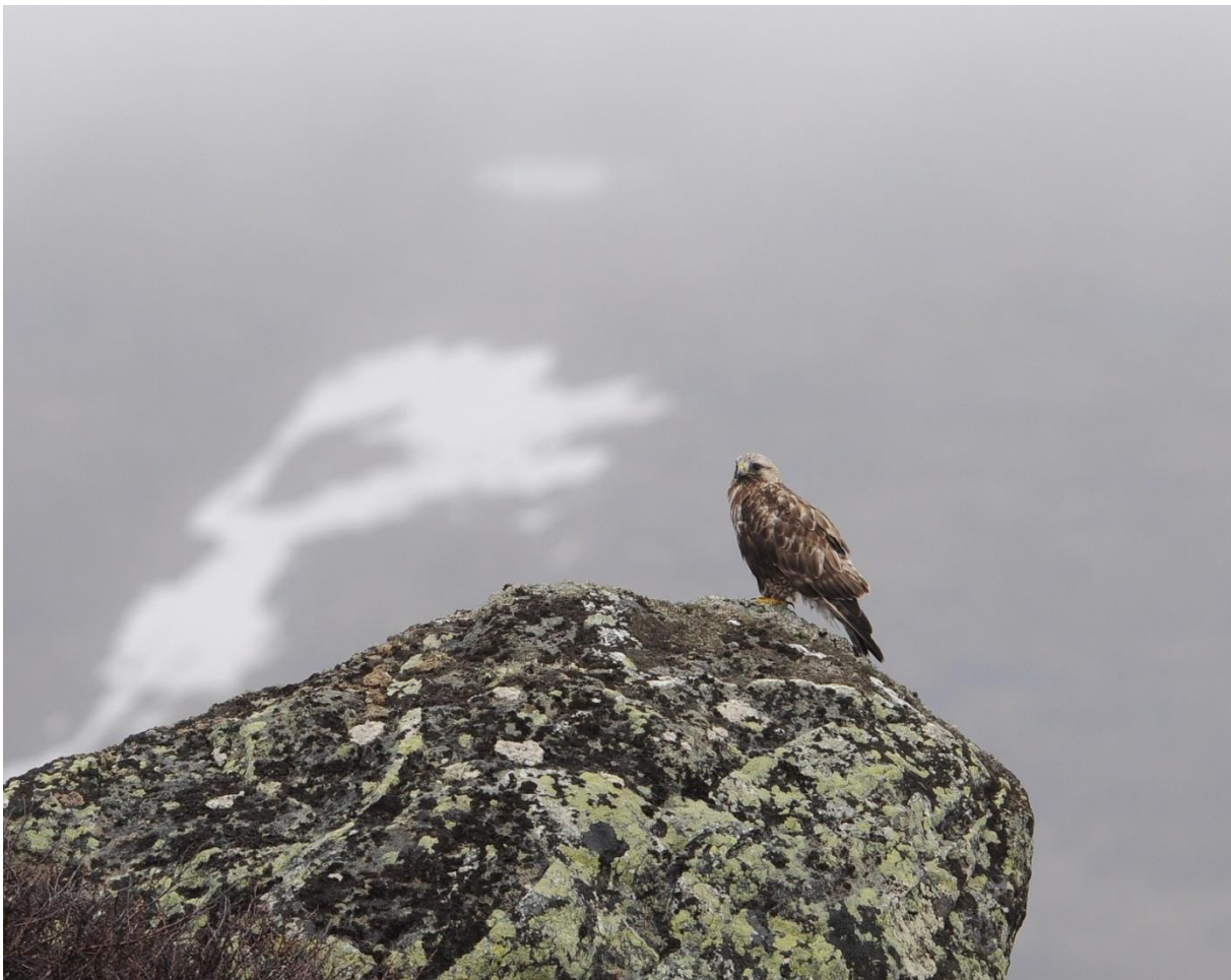
Fig.1. Fjellvåken er blitt sjeldnere i fjellheimen i Buskerud, selv i gode smågnagerår.

Fjellvåken står ikke oppført på den norske rødlista og har status som LC , som betyr at bestanden anses som livskraftig (Kålås m.fl. 2010).