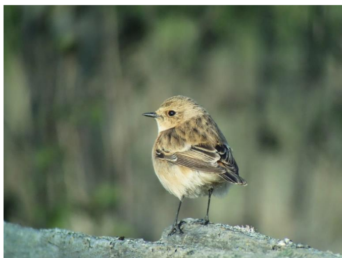
Asiasvartstrupe, den siste nye sjeldenheten i Buskerud sett på Mo gård i Hole 1.-7.11.2019.

Følgende arter er nye etter den siste publiserte artslista fra 2012: blåvingeand (2013), enghauk (2013), svartstrupesteinskvett (2014), silkehegre (2015), stellerand (2016), ørkensteinskvett (2016), tartarpiplerke (2018), svartstrupetrost (2018), alaskasnipe (2019), asiasvartstrupe (2019) og [munkegribb] (2019). Munkegribben fra 2019 gjelder den satellittmerka spanske munkegribben «Brinzola» som krysset Buskerud to ganger i september 2019. Denne ble oppdrettet i fangenskap i Spania før den ble sluppet fri for å styrke den sterkt trua frittlevende bestanden. Den regnes derfor som et ikke-spontant individ.