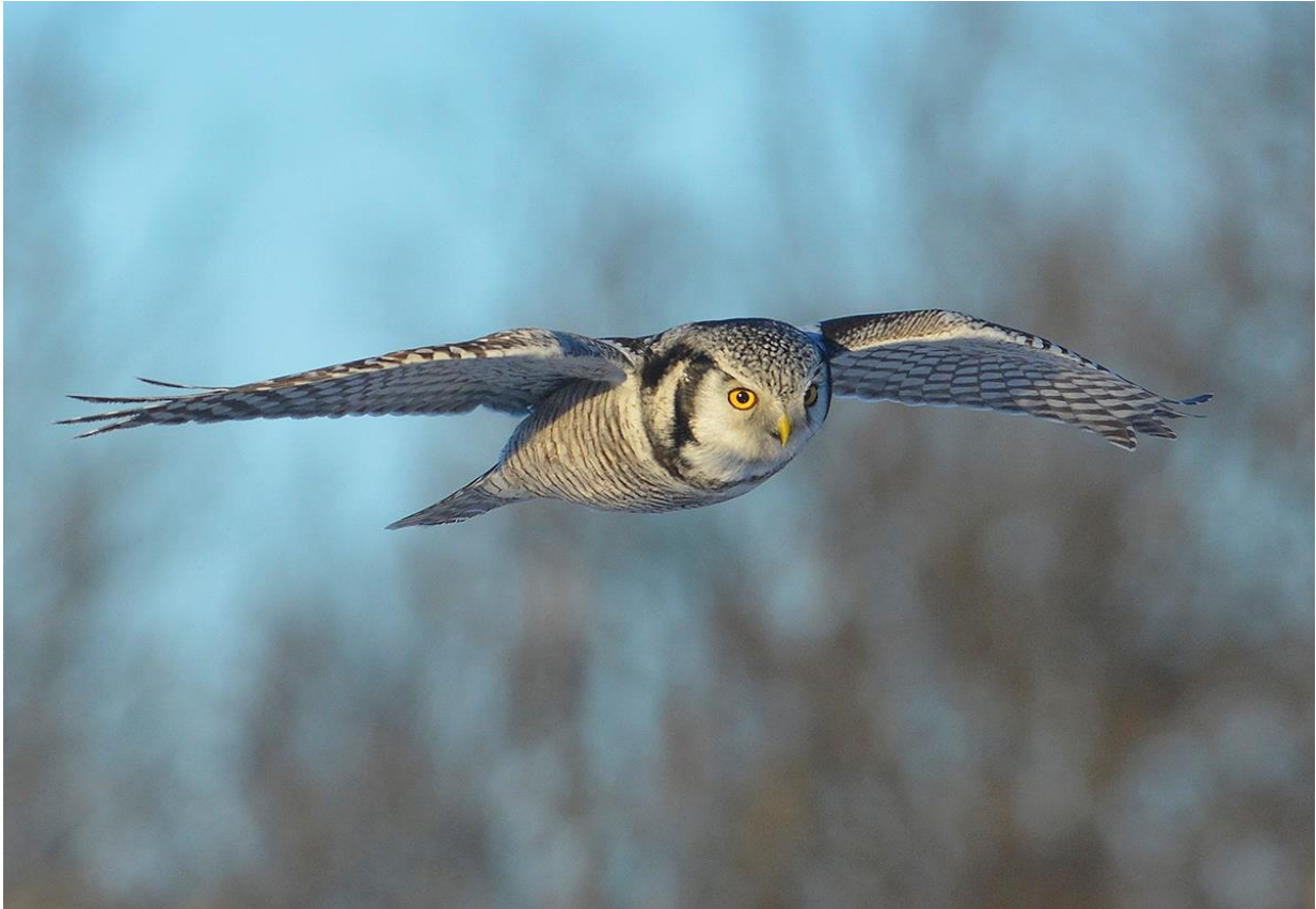
Årets fuglebilde i Buskerud: Haukugle på Fjellsnare i Nore og Uvdal 13.12.2018.