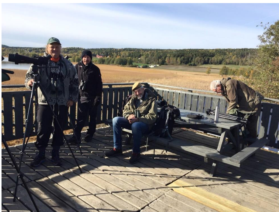
Deltagere på Fiskumvannet.

Totalt ble det registrert 77 arter og 2626 individer i løpet av de tre timene konkurransen varte. Dette sammen med vinnerresultatet på 49 arter er et ganske normalt resultat for denne konkurransen de siste årene. Men vi satte ny deltagerrekord i år med 8 lokaliteter og 26 deltagere. Steinsvika i Hole, Eikredammen i Hemsedal og Darbu i Øvre Eiker er nye lokaliteter på lista. Eikredammen er dessuten den første lokaliteten fra nordfylket som deltar i denne årlige konkurransen. De tre mest tallrike artene var: gråtrost 649 individer, kaie 383 individer og kråke 133 individer. Gråtrost toppet lista også på landsbasis. Av mer sjeldne arter kan følgende nevnes: stjertand, myrhauk og varsler på Fiskumvannet og varsler i Steinsvika. En smålom på Linnestranda bør også nevnes.